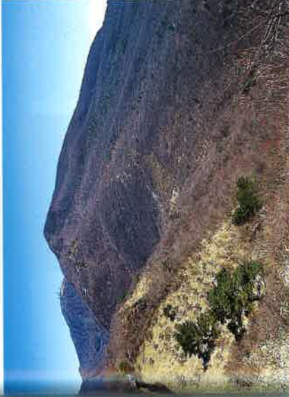
鍋割山の尾根から荒山と荒山高原を眺める