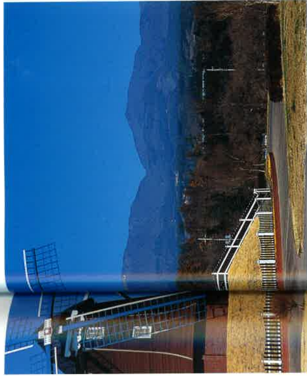
道の駅「ぐりーんふらわー」牧場から鍋割山(左)と荒山(右)の眺め

車場がある。駐車場の脇に「荒山高原入口」と書かれた道標があり、ここが荒山高原登山口だ。道標にしたがって山道に入る。