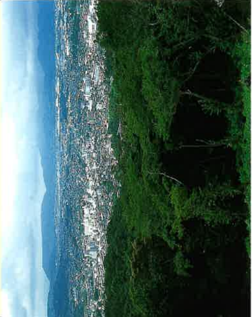
▲権現山山頂の展望台から秦野市街と法沢丘陵を見下ろす